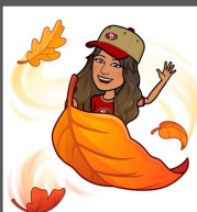
Carmen Hernandez រដ្ឋបាល EEP ប្រធានផ្នែក VIPS / អ្នកបកប្រែ / ក្រុមមាតាបិតា